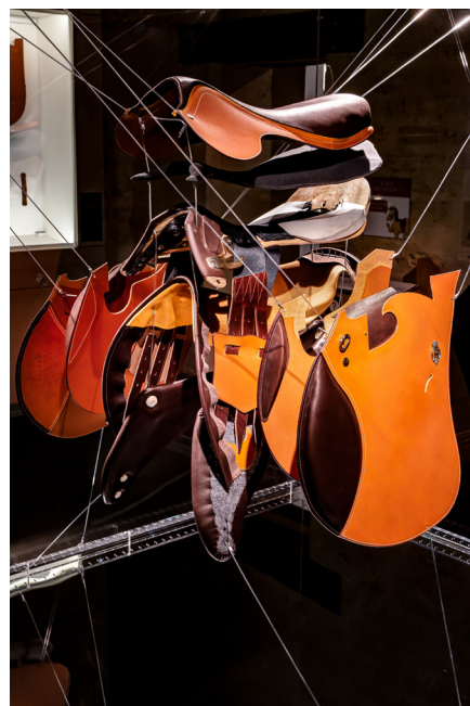
Musée vivant du Cheval

Une nouvelle salle consacrée aux courses hippiques a été aménagée. D'importants dépôts de France Galop (portraits de chevaux et de leurs propriétaires, précieux trophées du XIX e siècle) viennent y dialoguer avec les équipements de jockey. Enfin, le parcours livre de nouveaux outils de médiation et une nouvelle salle pédagogique pour que le musée soit plus interactif que jamais.