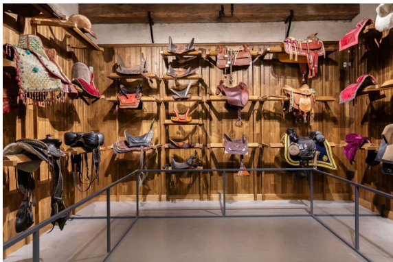
Musée vivant du Cheval

Par exemple, une dizaine de selles de dame illustre de l'évolution de la monte en amazone. Citons encore une quinzaine de selles de travail, de Camargue, du Brésil ou bien du Mexique, qui témoignent de l'importance du cheval dans la gestion des cheptels de bovins sur de grandes étendues. Les ensembles de mors, fers, étriers, éperons et tenues – celle du jockey notamment – complètent cette collection unique au monde.