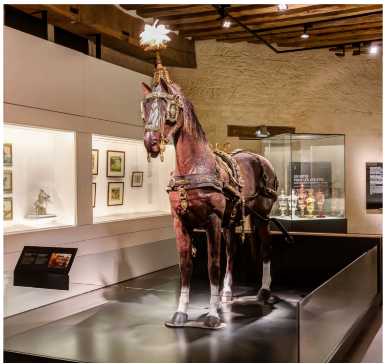
Musée vivant du Cheval © Sophie Lloyd